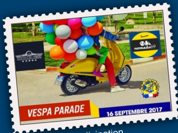
VESPA PARADE 16 SEPTEMBRE 2017

Quelques unes des nombreuses actions du Scooter Club Lyonnais sur l'année 2017